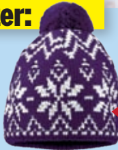
Schneeflocken. Schöpfungsschöpfel-Skimütze, 19,95 Euro.