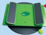
Sport Disc 600. Um 169,99 Euro.