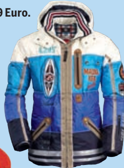
Bogner-Anorak. Für ihn um 1.299 Euro.