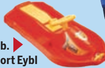
Bob Sport Eybl um 39,99 Euro.