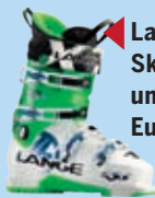
Lange-Skischuh um 549,95 Euro.