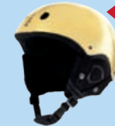
Fahrradhelm. KHM-Shop, 49 Euro.