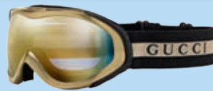
Nobel auf der Piste: Gucci-Skibrille um 169 Euro.